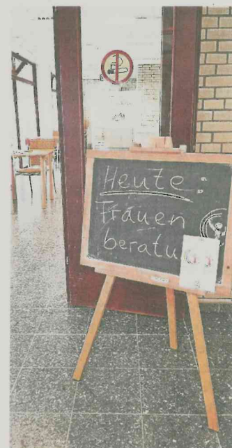
Das ist der neue Anlaufpunkt für Frauen in der Wasserwelt.

„Bei Fragen zur Beratung können sich Frauen auch gerne direkt an mich wenden“, versichert die Gleichstellungsbeauftragte Franca Calvano. Sie ist unter der Telefonnummer 02058/18-219 erreichbar – oder